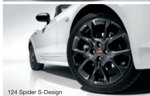
124 Spider S-Design